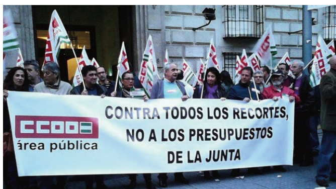
Concentración en Málaga

Carbonero ha avanzado que el sindicato expondrá en comparecencia parlamentaria la postura de CCOO sobre unos presupuestos “que ahondan en el recorte” y la presentará por escrito ante los grupos parlamentarios, a los que ha pedido que “le echen más cuenta a las comparecencias y que estas no se conviertan en algo rutinario sin ningún resultado”. “Por el bien del Parlamento deberían prestar atención a lo que vamos a decir y tomar nota para modificar unos presupuestos que entendemos son modificables”. Asimismo ha reclamado que haya una exigencia al gobierno de España para que los PGE no discriminen a Andalucía y permitan hacer políticas para salir de una situación peor aún que la del resto del país.