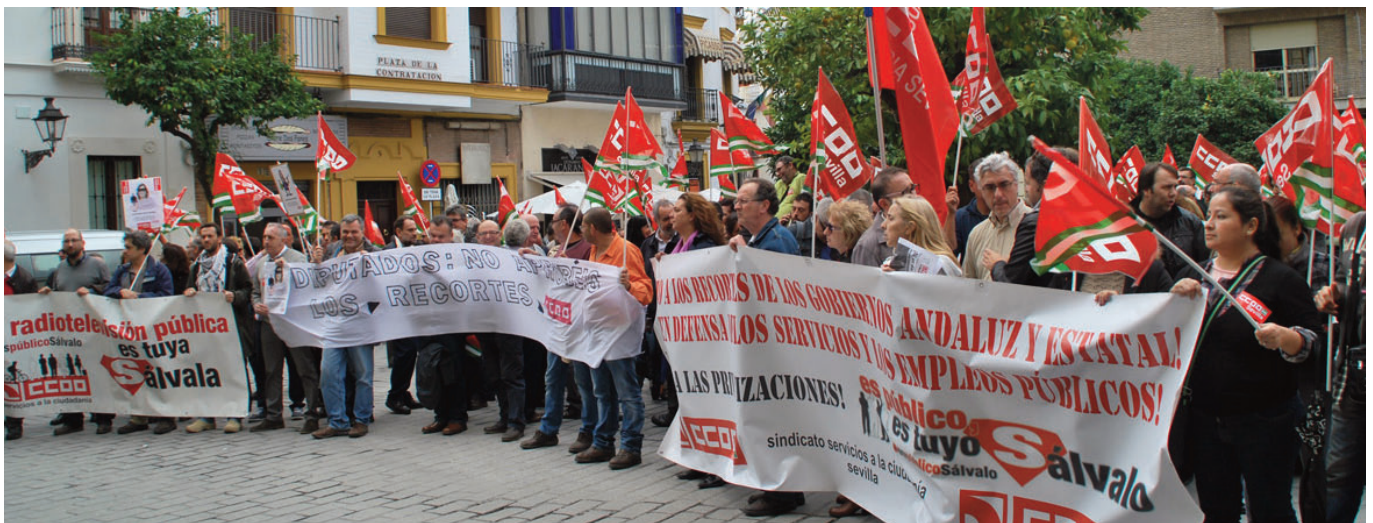
Concentración en Sevilla

Carbonero hace un llamamiento a los grupos parlamentarios para que "echen más cuenta a las comparecencias y tomen nota para modificar unos presupuestos que ahondan en el recorte y "entendemos que son modificables". CCOO recuerda que la próxima cita en Andalucía contra los presupuestos será el 26 de noviembre con una movilización regional, aunque previamente habrá un acto en Madrid el día 19