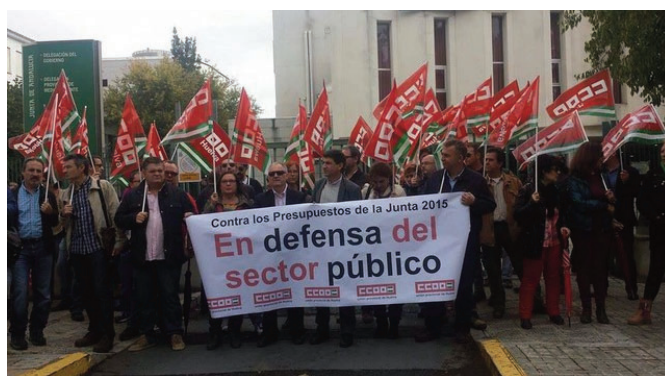
Concentración en Huelva