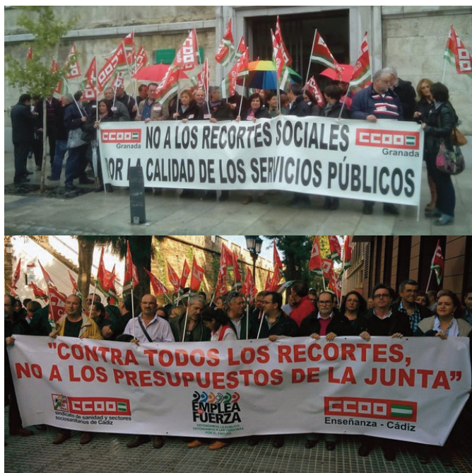
Concentraciones en Granada y Cádiz