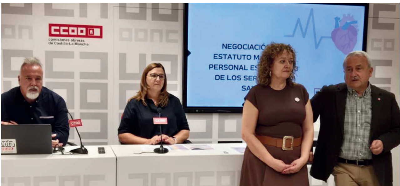
Asamblea informativa sobre la negociación del Estatuto Marco del Personal Estatutario de los Servicios de Salud