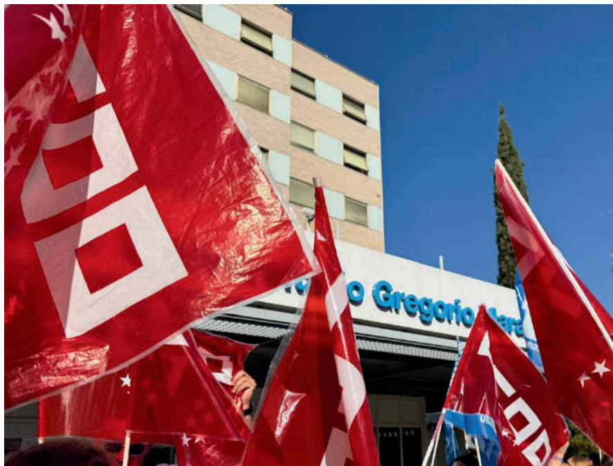
Concentración estatal en las puertas de los centros de trabajo durante la negociación del Estatuto Marco