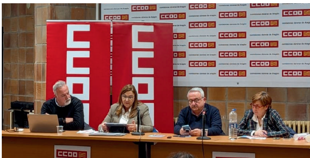
Asamblea informativa sobre la negociación del Estatuto Marco del Personal Estatutario de los Servicios de Salud