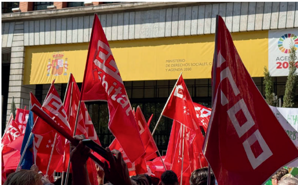
Concentración estatal frente al Ministerio de Sanidad durante la negociación del Estatuto Marco