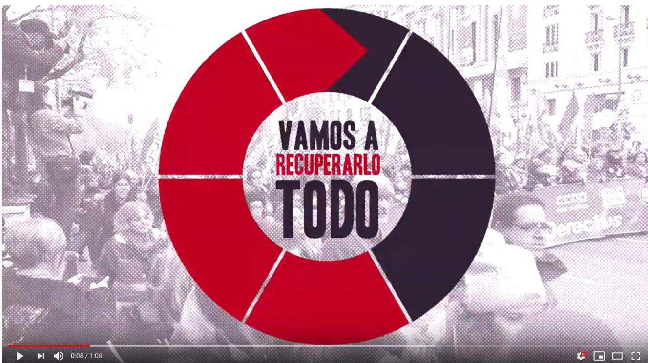
#RecuperarLoArrebatado Vamos a recuperarlo todo

Pelemos por el cumplimiento íntegro de los acuerdos alcanzados en Función Pública. Por recuperar todos los derechos arrebatados a más de 3 millones de empleadas y empleados públicos.