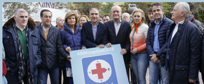
La plana mayor del PP, hace un año, exige el Chare en la zona este.

Estas reuniones se plantean como paso previo a las posibles movilizaciones planteadas por la plataforma y que comenzarán a plantearse una vez se conozca de primera mano las propuestas que desde la Consejería de Salud se hayan elaborado para la zona Este de Málaga.